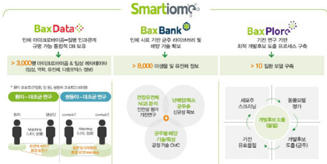
[마이크로바이옴 치료제 개발 플랫폼 - 스마트iom]

국내 1위 건강기능식품인 홍삼의 시장점유율이 점차 떨어지고 있는 반면 프로바이오틱스는 꾸준히 성장하고 있다는 점을 볼 때, 향후 프로바이오틱스 시장 잠재력은 상당한 수준에 이르렀습니다. 그러나 현재 장기능 개선 기능성을 주장하는 프로바이오틱스 제품들은 매우 많으며, 제약사, 식품기업 및 바이오기업 등이 출시한 다양한 브랜드가 시장에 난립되어 있습니다. 프로바이오틱스 브랜드의 배타적 경쟁력을 확보하기 위해서는 탄탄한 지식재산권 및 개별인정 등을 통해 독점적인 지위를 확보할 필요성이 있으며, 위바이옴은 지속적인 연구 개발과 신규 설비 도입 등을 통해 이러한 준비를 착실히 수행해 나가고 있습니다. 특히 프로바이오틱스의 다양한 기능성에 대한 연구 결과들이 제시됨에 따라, 규제기관인 식품의약품안전처의 개별인정을 받는 프로바이오틱스 소재들 역시 점차 증가하고 있습니다. 따라서, 향후 장기능 개선 외 별도의 건강 기능성을 주장할 수 있는 프로바이오틱스 소재들이 건강기능식품 시장에서 경쟁력 있는 지위를 확보할 것으로 예측됩니다.