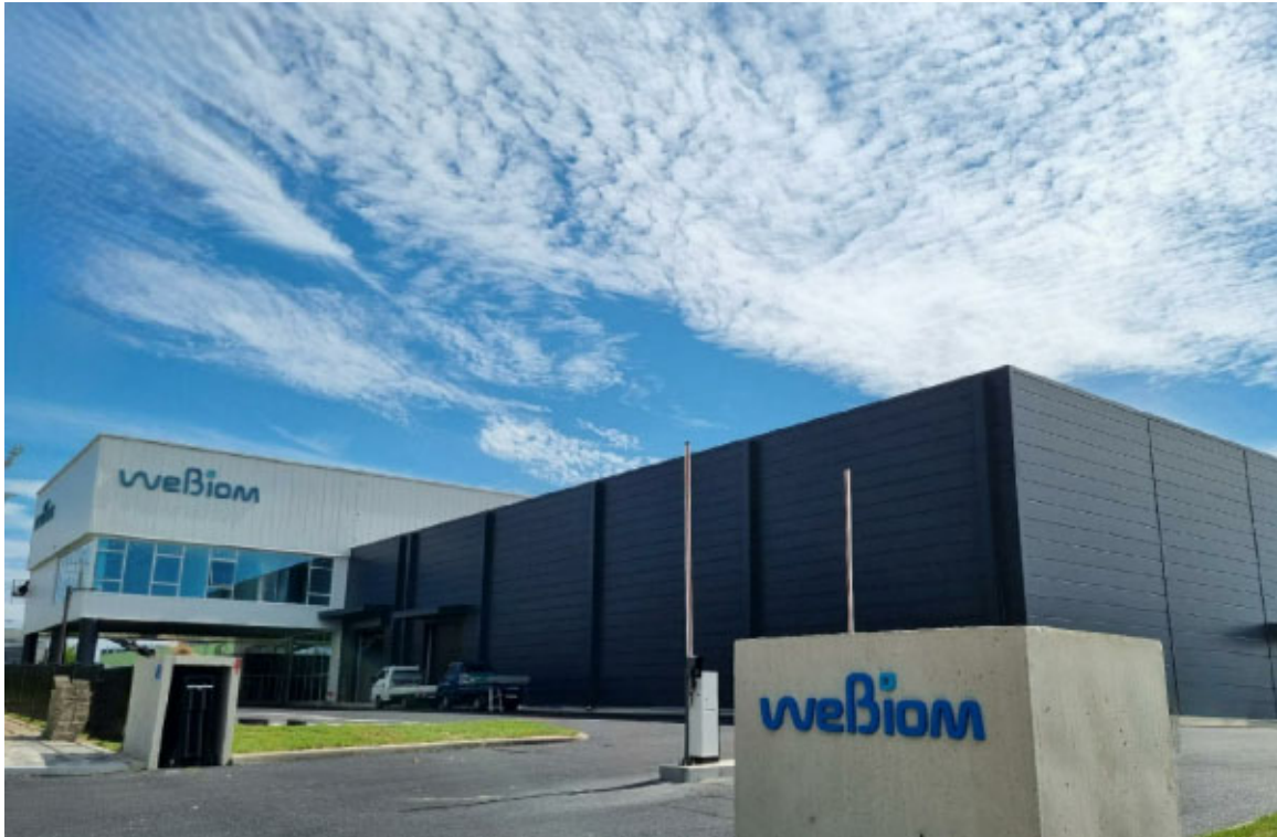
위바이옴 프로바이오틱스 공장